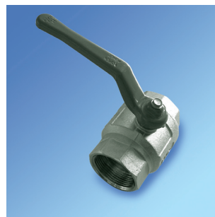
Zawory kulowe 2/2, gwint wewnętrzny/wewnętrzny