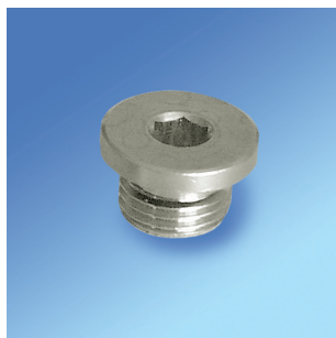
Korki zaślepiające z kołnierzem