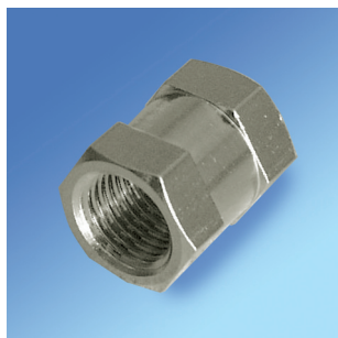
Łączniki nakrętne - mufy